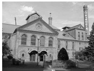
サッポロビール博物館