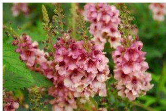
ハーバスクムササンチャーム