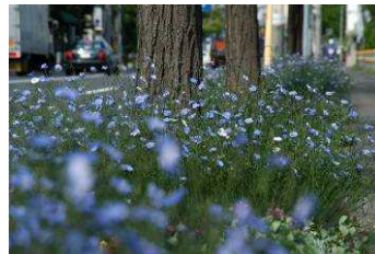
北8条通りに咲く亜麻